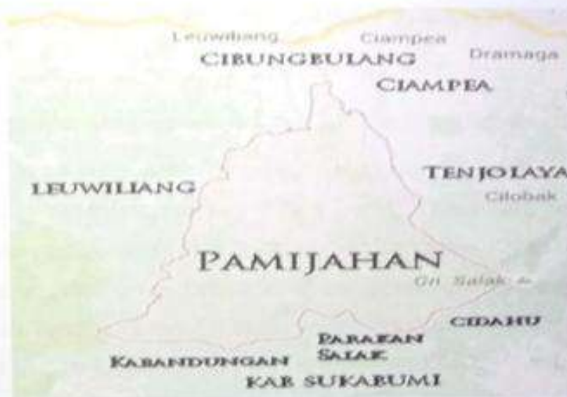
Gambar 2. Peta Kecamatan Pamijahan